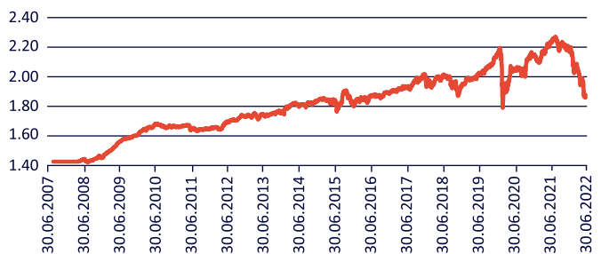
Plāna daļas vērtība kopš 31.10.2007., EUR