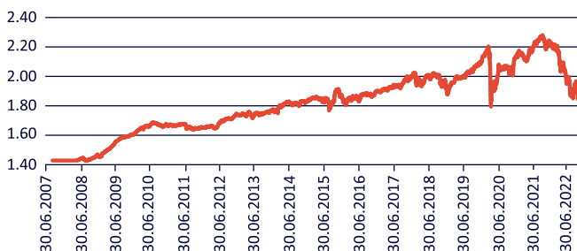
Plāna daļas vērtība kopš 31.10.2007., EUR